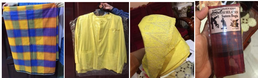
Gambar 3: pakaian masyarakat Bugis yang masih digunakan sehingga kini

Etnik Bugis juga memiliki pakaian khas bagi adat istiadat diraja berwarna kuning keemasan. Pakaian tersebut melambangkan warna diraja. Etnik Bugis juga mempunyai berjenis-jenis tanjak yang digayakan bersama kain sarung khas Bugis yang di tenun. Tanjak masyarakat Bugis kebiasaan digunakan pada zaman Kesultanan Melayu Melaka. Ia digunakan ketika belayar, mengembara dan semasa berada di atas kapal perang Bugis (Radzie Sapie,2018). Pada zaman ini tanjak juga turut digunakan oleh etnik Bugis apabila mereka menyertai program yang melibatkan dan menghimpunkan etnik mereka.