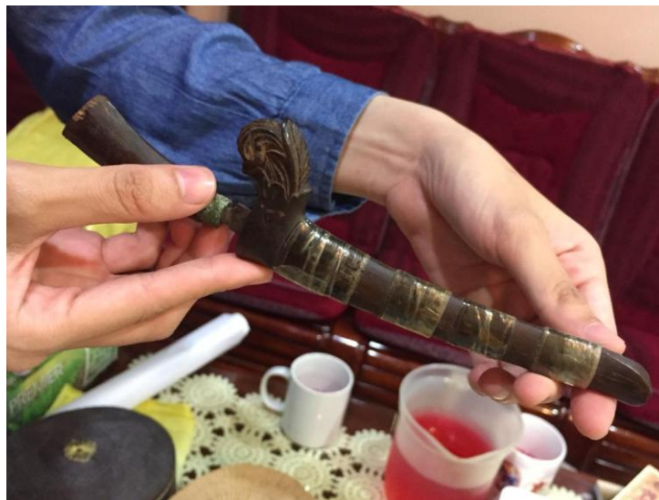
Gambar 5: Badik yang mempunyai bentuk yang kecil

seperti pisau kecil yang tajam. Menurut Raja Yunus (2018), badik mempunyai sifat yang dipengaruhi oleh pemiliknya. Sifat ini dapat memberikan keadaan tuannya yang mendatangkan sifat semulajadi kepada menyimpannya. Etnik Bugis mempercayai bahawa badik mempunyai kuasanya yang tersendiri. Dari zaman dahulu, badik digunakan sebagai alat untuk membela diri dan berburu tetapi juga sebagai identiti dalam sebuah masyarakat. Pada am nya, badik terdiri daripada tiga bahagian, iaitu hulu (gagang) iaitu tempat memegang senjata tersebut dan bilah (besi), serta sarung badik. Seni mempertahankan diri masyarakat Bugis terkenal dengan persilatan yang namanya Silat Gayung Serantau Malaysia (Zahari Zainal, 2011). Ia diwujudkan bertujuan untuk mempertahankan diri dari serangan musuh. Pada zaman dahulu, orang Bugis menggunakan silat ini bagi melindungi diri daripada musuh. Silat ini dipercayai telah wujud sejak zaman Kesultanan Melayu Melaka dalam usaha menentang kemasukan penjajah dan daripada ancaman musuh.