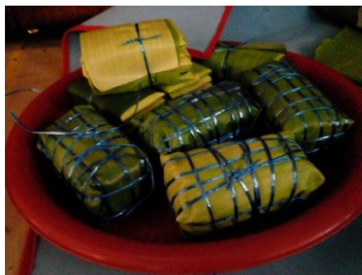
Gambar 4: Burasak yang telah dimasak