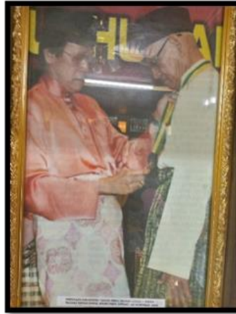
Gambar 10: Menerima Anugerah Tokoh Maal Hijrah Kedah 1431 Hijrah