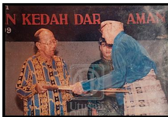
Gambar 9: Menerima Anugerah Tokoh Sejarawan Kedah pada tahun 1999, yang disampaikan oleh Almarhum Sultan Kedah Al-Sultan Al-Mu'tassimu Billahi Muhibbuddin Tuanku Al-Haj Abdul Halim Mu'adzam Shah ibni Almarhum Sultan Badlishah