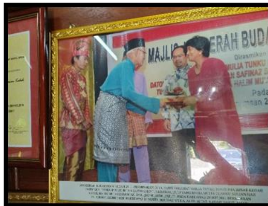
Gambar 8: Menerima Anugerah Budayawan Negeri Kedah yang disampaikan oleh Yang Teramat Mulia Tunku Temenggong Kedah Brigadier Jeneral Dato' Seri Diraja Tan Sri Tunku Puteri Intan Safinaz binti Almarhum Sultan Abdul Halim