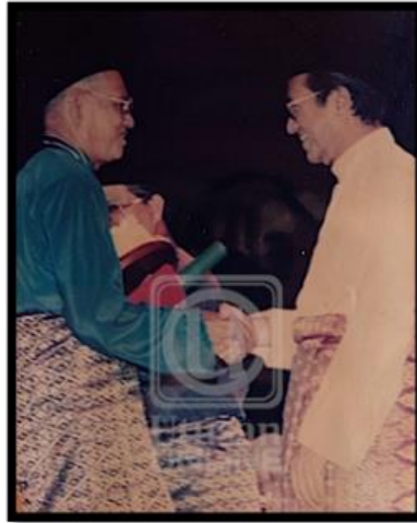
Gambar 7: Menerima Anugerah Tokoh Guru Peringkat Kebangsaan yang disampaikan oleh Tun Dr. Mahathir Mohamad (Perdana Menteri Malaysia ke-Empat)