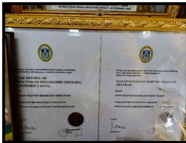
Gambar 11: Diberi pengiktirafan oleh Universiti Utara Malaysia Ijazah Kehormat Doktor Falsafah (Sejarah) sempena Majlis Konvokesyen UUM ke-21