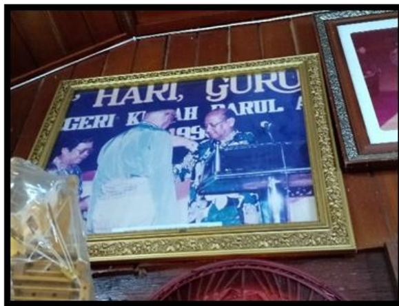
Gambar 6: Menerima Anugerah Tokoh Guru Peringkat Negeri Kedah Yang disampaikan oleh Almarhum Al-Sultan Al-Mu'tassimu Billahi Muhibbuddin Tuanku Al-Haj Abdul Halim Mu'adzam Shah ibni Almarhum Sultan Badlishah