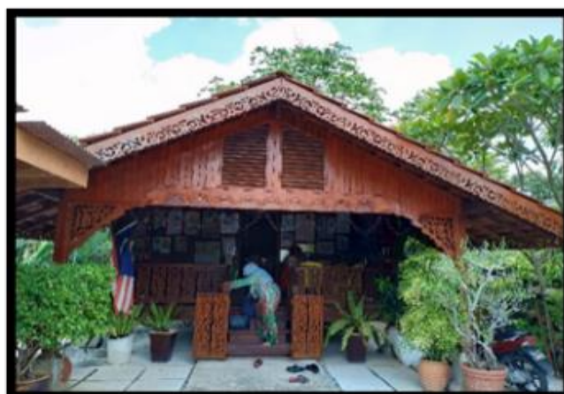
Gambar 3: Teratak Iskandar