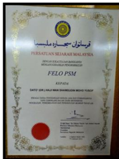
Gambar 12: Anugerah Felo kali ke-6 yang dianugerahkan oleh Persatuan Sejarah Malaysia