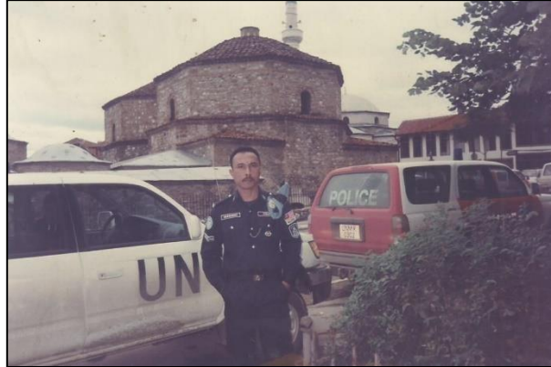
Gambar 1: Ketika beliau bertugas di Kosovo pada tahun 2000