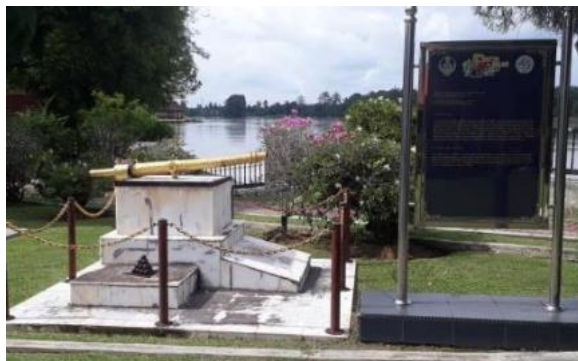
Gambar 9: Tugu Meriam Lela Rentaka