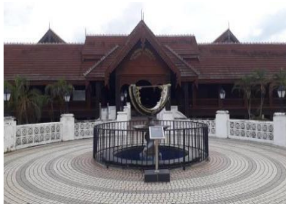
Gambar 2: Terowong Sejarah

Di Kompleks Sejarah Pasir Salak, sememangnya terdapat pelbagai binaan-binaan bersejarah yang boleh dilawati. Selain daripada bahan-bahan yang dipamerkan samada keris, barang-barang budaya sejarah yang lain sebagai barang pameran, sebenarnya bangunan itu sendiri menjadi salah satu bahan dalam konsep pameran kepada masyarakat dan pengunjung. Bukan itu sahaja, selain Terowong Sejarah, Galeri Sejarah Menteri Besar, Rumah Kutai 1, Rumah Kutai 2, terdapat juga monumen dan juga tugu di Kompleks Sejarah Pasir Salak ini dimana kalau daripada pintu masuk utama, akan terdapat Pentas Belotah, pentas yang digunakan untuk tarian lotah. Selain itu, terdapat juga menara pandang dimana senibinanya diadaptasi daripada bentuk menara pandang Pavillion di Kuala Kangsar dan senibina ini sudah berumur hampir seratus tahun lebih. Tambahan lagi, terdapat juga tugu-tugu peringatan antaranya Tugu Peringatan Pahlawan Perak, Tugu Peringatan Birch dan Tugu Lela Rentaka. Akhir sekali, terdapat dua buah arca yang satu diletakkan di depan Terowong Sejarah yang dinamakan arca „Jam Suria“ atam jam matahari di mana penunjuk waktunya berdasarkan kepada bayang yang terhasil daripada pergerakan matahari manakala arca kedua iaitu arca dua bilah keris