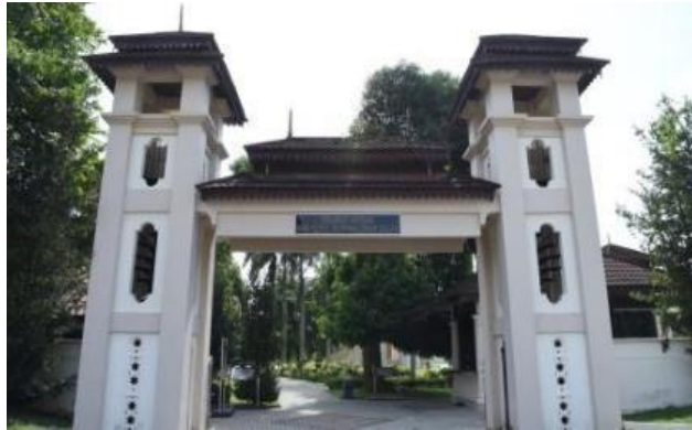
Gambar 1: Kompleks Sejarah Pasir Salak

Penubuhan Kompleks Sejarah Pasir Salak mula rasmi dibina pada 26 Mei 1990 namun pada tahun 1989, telah bermula fasa pertama pembinaan Rumah Kutai 1, Rumah Kutai 2, Tugu Peringatan Birch, Jeti kayu, Tugu Lela Rentaka dan surau. Pembangunan fasa pertama Kompleks Sejarah Pasir Salak ini berterusan dan giat dibina pada tahun 1998. Binaan-binaan tersebut adalah yang diambil alih daripada rumah sedia ada yang berada di atas tapak asal dan fasa pertama ini siap dibina pada 26 Mei 1990.