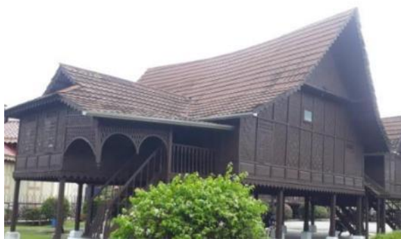
Gambar 8: Rumah Kutai

Selain itu, Rumah Kutai merupakan antara binaan bersejarah yang terdapat di dalam Kompleks Sejarah Pasir Salak. Menurut (Mohd Fauzi, 2020), selaku penolong kurator di kompleks tersebut terdapat dua jenis buah Rumah Kutai iaitu Rumah Kutai 1 kepunyaan Tuan Haji Wok Bin Haji Mad Kulop. Rumah Kutai Tuan Wok bin Hj Kulop Mad Arsyad ini terletak dalam fasa pertama pembangunan Kompleks Sejarah Pasir Salak. Ia dibina sekitar tahun 1989 yang dibangunkan untuk baik pulih dan selenggara serta disesuaikan dengan pelbagai jenis pameran. Di samping itu, Rumah Kutai 2, merupakan Rumah Kutai baru, yang dibina pada 1986 dalam fasa kedua pembangunan Kompleks Sejarah Pasir Salak.