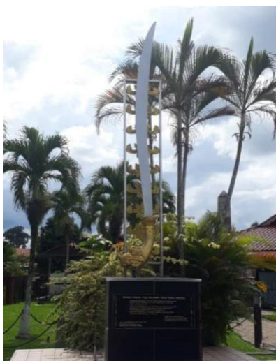
Gambar 7: Tugu Peringatan Pahlawan Perak

Tugu Peringatan Pahlawan Perak merupakan tugu yang dibangunkan untuk mengingati dan mengenang bakti pejuang-pejuang Pasir Salak yang