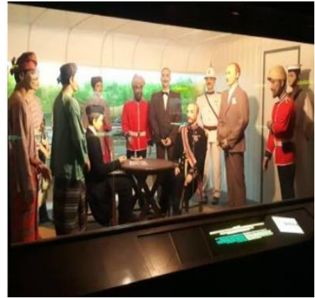
Gambar 3 dan 4: Suasana dalam Terowong sejarah

Terowong Sejarah merupakan bangunan bersejarah yang dibina untuk mengenang kembali insiden kenangan kembali insiden Pasir Salak dengan mengambil pendekatan teknologi yang terbaik daripada "Museum of Yala" di Thailand. Ia menceritakan tentang perjalanan sejarah secara kronologi dari awal sampailah mencapai merdeka. Dalam konteks senibina, ia merupakan bangunan kayu sepanjang 117 kaki dimana struktur asasnya adalah konkrit manakala luarannya, ragam hiasnya dan kemasan akhirnya menggunakan kayu dan ukiran-ukiran kayu. Pandangan hadapan Terowong Sejarah ini menggabungkan tiga elemen senibina yang utama. Pertama, bahagian hadapannya adalah Istana Melayu Lama, bahagian belakangnya pula adalah Istana Impian Raja Abdullah dan di bahagian bumbung utama setengah-setengah bangunan ini, bentuk bumbungnya menyamai bentuk bumbung Rumah Kutai. Tambahan pula, Terowong Sejarah juga dalam bangunan yang sama menempatkan galeri keris dimana bahagian atasnya adalah terowong dan di bahagian bawahnya adalah galeri keris. Pameran dalam Terowong sejarah ini dipamerkan dalam bentuk diorama iaitu tiga dimensi.