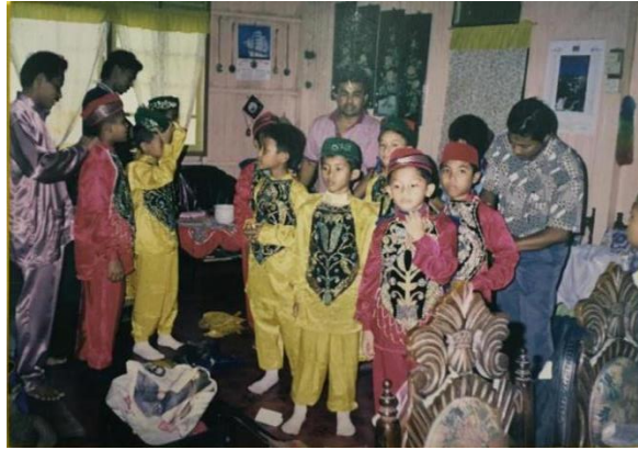
Gambar 2: Para penari (Hasil Sumbangan Tokoh)