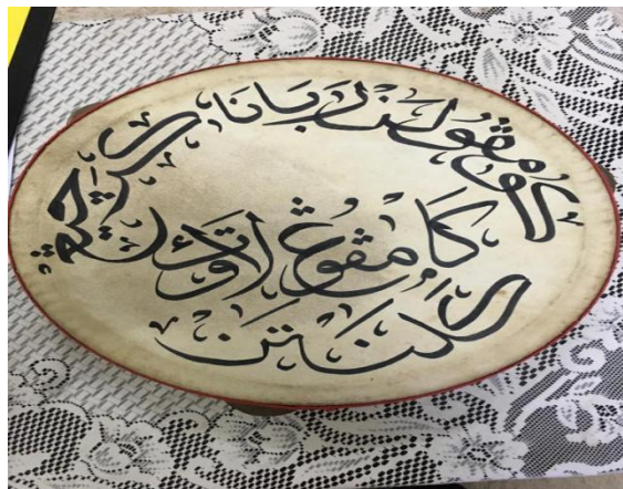
Gambar 3: Rebana Kercing Rasmi Persatuan Rebana Kercing Kampung Laut (Hasil Sumbangan Tokoh)

jantan. Menurut beliau, bunyi paluan rebana yang dihasilkan menggunakan kulit kambing betina menghasilkan bunyi yang lebih sedap didengar. Bagi bahagian bingkainya pula, batang pokok nangka telah menjadi pilihan. Ini kerana bingkai yang diperbuat daripada batang pokok nangka lebih kuat jika dibandingkan dengan kayu-kayu lain. Selain itu, bahagian kercing yang dihasilkan daripada tembaga ini telah menghasilkan bunyi seakan-akan bunyi loceng. Selain itu, jumlah pemain Rebana Kercing ini memerlukan lapan hingga sepuluh orang dewasa sebagai pemalu rebana. Oleh itu, dapat disimpulkan bahawa bunyi yang dihasilkan oleh Rebana Kercing ini mempunyai daya tarikannya yang tersendiri.