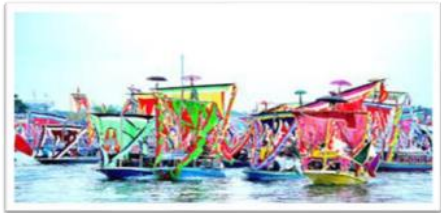
Gambar 1: Lepa yang dipertandingkan di Regatta Lepa

Regatta Lepa ini disertai dengan iringan muzik dan tarian “igal-igal” oleh penari yang akan berdiri di Lepa tersebut. Penari akan memakai pakaian tradisional semasa pertunjukan tarian. Pakaian tradisional Ala Bimbang selalunya dipakai semasa pesta perahu ini yang melambangkan keagungan suku kaum Bajau pada zaman dahulu. Pakaian ini akan digayakan oleh perempuan suku kaum Bajau sambil menari tarian “igal-igal”.